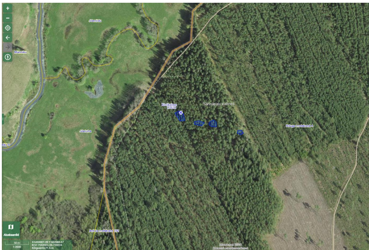
Lisa 1. Kivikalmete reg-nr 13647-13651 asukohad Maa-ameti kultuurimälestiste kaardikihil seisuga 25.01.2024.